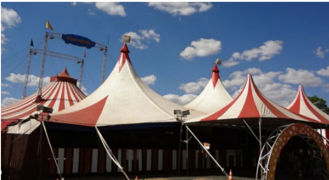
വിനോദ നികുതി, സിനിമാ തിയേറ്ററുകളുടെ നിർമ്മാണം, സിനിമാ പ്രദർശനത്തിനുള്ള ലൈസൻസ് - കൈപ്പുസ്തകം