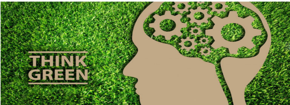
അക്രഡിറ്റഡ് ഏജൻസികളുടെ തെരഞ്ഞെടുപ്പും പ്രവൃത്തി നിർവ്വഹണവും കൈപ്പുസ്തകം