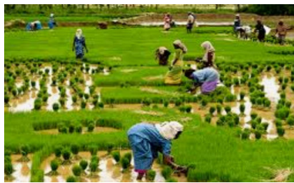
പതിനാലാം പദ്ധതിയുടെ വിവിധ മാർഗ്ഗരേഖകളുടെ തുടർ ഉത്തരവുകൾ-കൈപ്പുസ്തകം

ഓരോ മേഖലയിലും ലക്ഷ്യമിടുന്ന മാറ്റം ഉൾക്കൊണ്ടുകൊണ്ടുള്ള പദ്ധതി ആസൂത്രണ, നിർവ്വഹണ, വിലയിരുത്തൽ നടപടികൾ കാര്യക്ഷമമാക്കുന്നതിന് ഉത്തരവാദിപ്പെട്ട കമ്മിറ്റികളും ഉദ്യോഗസ്ഥരും പദ്ധതി മാർഗ്ഗരേഖകളുടേയും സബ്സിഡി, ധനസഹായ മാർഗ്ഗരേഖയുടേയും തുടർ ഉത്തരവുകളുടേയും അസ്സലുകൾ പരിശോധിക്കേണ്ടത് അനിവാര്യമാണ്. ഇതിന് സഹായകമാകും വിധത്തിൽ വിവിധ വിഷയങ്ങളിൽ വരുത്തിയ ഭേദഗതികളുടെ ഉത്തരവുകളുടെ സംക്ഷിപ്തമാണ് അടുത്ത അധ്യായത്തിൽ ഉൾപ്പെടുത്തിയിട്ടുള്ളത്.