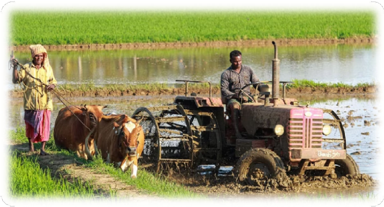
പതിനാലാം പദ്ധതിയുടെ വിവിധ മാർഗ്ഗരേഖകളുടെ തുടർ ഉത്തരവുകൾ-കൈപ്പുസ്തകം

വ്യക്തിഗത ഗുണഭോക്താക്കൾക്കു വേണ്ടിയുള്ള ഉല്പാദന പ്രോജക്ടുകൾ ഗ്രാമപഞ്ചായത്തുകൾ നടപ്പാക്കുമ്പോൾ ബ്ലോക്ക്-ജില്ലാ പഞ്ചായത്തുകൾക്ക് പങ്കാളികളാകാൻ അനുമതി നൽകി. അനിവാര്യവും സംയുക്തമായി നടപ്പാക്കുന്നതിന് പ്രായോഗികവുമായ മേഖലകളിലെ പ്രോജക്ടുകൾ മാത്രമേ ഏറ്റെടുക്കാവൂ. വിഹിതം ഗ്രാമപഞ്ചായത്തിന് കൈമാറേണ്ടതാണ്.